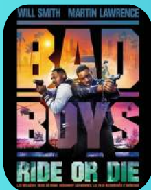
BAD BOYS RIDE OR DIE