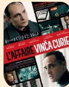
L'AFFAIRE VINCA CURIE