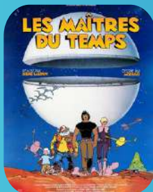
LES MAÎTRES DU TEMPS