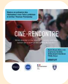
PROGRAMME COURT MÉTRAGES