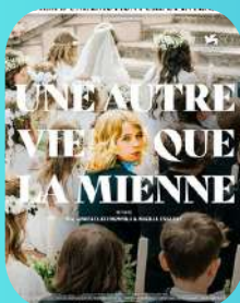
UNE AUTRE VIE QUE LA MIENNE