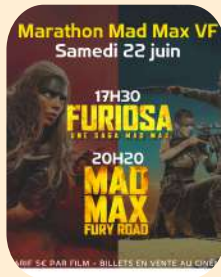
MARATHON MAD MAX