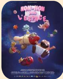
NON-NON DANS L'ESPACE