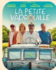
LA PETITE VADROUILLE