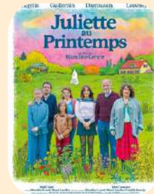
JULIETTE AU PRINTEMPS