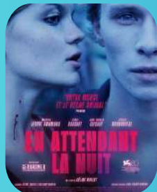
EN ATTENDANT LA NUIT