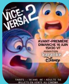
AVANT-PREMIERE VICE-VERSA 2