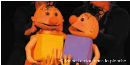
© Mona Le clou dans la planche

Déferlement d'émotions sur une île... pas vraiment déserte ! Car c'est là que vivent les Zertes ! Des êtres étranges et loufoques, complètement marteaux, gloutons, bêtas et, surtout, terriblement attachants. De courses-poursuites en chutes vertigineuses, ils font rimer coups durs et coups de foudre, histoires d'amitié et d'amour. Un spectacle de marionnettes qui fera le régal des petits à partir de 5 ans.